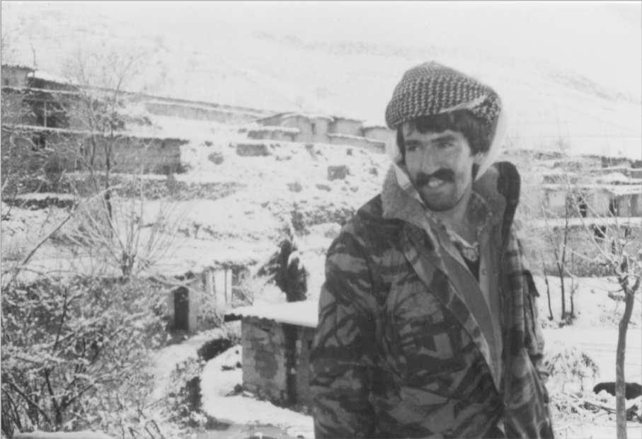
خه بات كه روكي پاش بريند اريووني - ۱۹۸۷

منيش و هكو شاهيدي و ه فايه ك بهر ام بهر كاك ره به يري سه يد برايم چه زم كړد نهم باسه پكه مه دل و پيك له ده ر ياي دلسو زي نه و بهر يزه ... نه و كاته ي ده نگ و ايو و كاك ره به يري بيت به فهرماندي تيه به كه مان، تسي ۲۵ ي خا لخالان، نه مده ناس ي زور ي ش له پيشمه رگه و جه ما و ه ي ناوچه كه هه روايوون، به لام له پاش كو يونه و ه كه ي سه رگه لو كه كاك و ه هاب پني كړدين و بهر ياريكي سه روتر كاك ره به يري بوو به فهرماندي تسي ۲۵ ي خا لخالان، به ما و ه يه كي كه م پيشمه رگه و جه ما و ه ي ناوچه كه بو يان دهر كه وت، كه پيشمه رگه و فهرماندي يه كي چه ند قسه خو ش و خه مخوره بؤ گله ستمه ديده كه ي، بويه به ما و ه يه كي زور كه م بوو به خو ش و يستي هه مو وان. له گيرانه و ي نهم داستا نندا ده م و ي ت ناما زه يه كيش به هه لو يستي نهم بهر يزه بدم. داستا نه كه ش داستا ن ي كرت ي