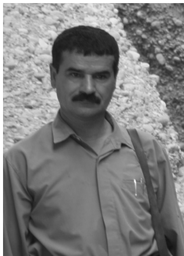
جوامير نه حمده ي پارتيزان

پرسيم : نيوه پيښج براى پارتيزان بوون ، نهى خيزانه كاتان له كوئى ده ژيان ؟؟ له ولامدا جواميرى پارتيزان ووتى: هممو خيزانه كه مان به نهينى له عه ربه ت ده ژيان ، كاتى خوى بههوى په رته وازهيمنان نه مان توانيسو ره وانسه ئيرانيان بكهين، تا سالى 1990 كه سيكيان پينا ساندن گوايا سيقه پيكراره، نيمه ش دايمك خيزانى من و خيزان و منالى شهيد هادى پرامان دايه دست تا ره وانسه ئيرانيان بكات ، بهلام به داخوه نهو سهره ر ژيم بوو، هممو خيزانه كه مانى به گرتنداو ره وانسه ئه مننه سورپه كه كران ، نامازى به هه لويستى بويرانه ي دايمى كرو ووتى: همميشه هه والى دهنارد كه نيمه بيرله هاتنه وه و تسليم بونه نه كهينه وه، كاتيك كه براكانيشمان شهيد بوون، دايمك به خه لكه كه ي دوت: سهره خوشيم ليمه كه ن كوره كامن خويان پيښان خوش بووشه هيدبن ئيت من بوجى بگريم ؟ دواتر يرش ووتى: خيزانه كه ي من دوو گيان بوو كه گيرا، له زيندان من دالى بوو سهرجه م خيزانه كه مان هه ر زيندان بوون، هه تا راپهړين و شكاندى دهرگاي زيندانه كان له لايه ن جه ماوهره وه. هه روه هادواى راپهړين هممو نهو نوسراوانه مان نه سكته وت كه بوم خيزانه كه ي نيمه وه ماله فيك كرابووه و ژماره ي (40) لاپهړه بوو، بههوى نهو