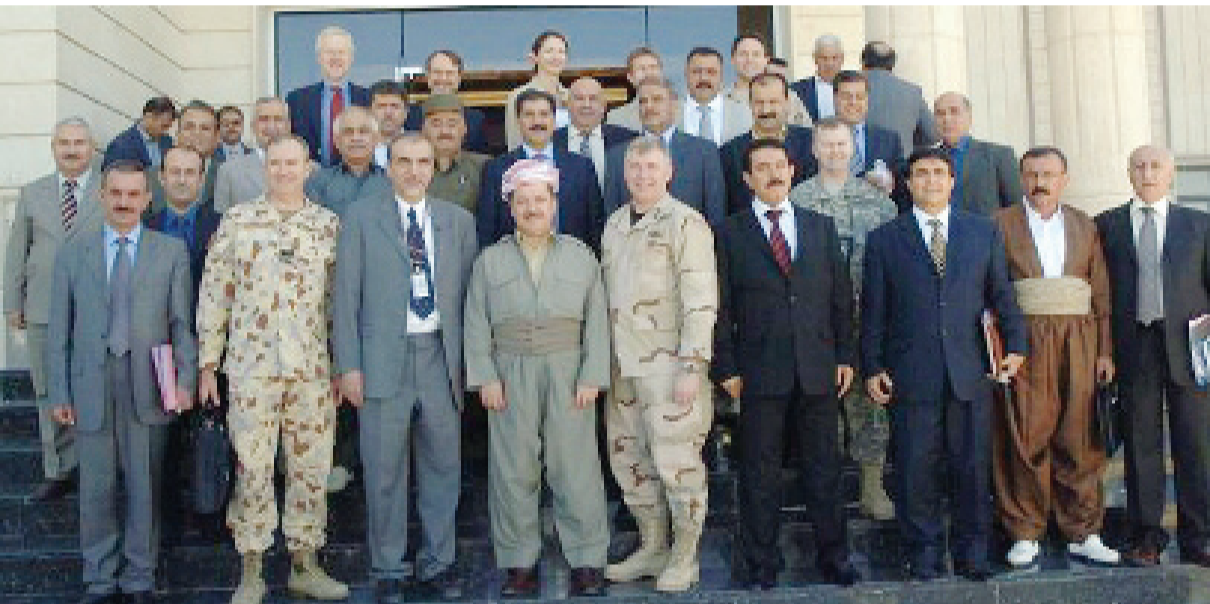
له‌وه‌رگه‌یه‌وه PUK media - وه‌ره‌گراره

به‌سه‌ره‌یه‌شتی به‌رێزان کاک مه‌سه‌وع بارزانی سه‌رۆکی هه‌ریه‌م و کاک کۆسه‌رت ره‌سول عه‌لی جیگری سه‌رۆکی هه‌ریه‌می کوردستان رۆژی 2006/9/18 له‌ هاوینه‌ هه‌واری سه‌لاحه‌دین کۆبوونه‌وه‌ی هاوبه‌شی گواستنه‌وه‌ی لێپرسراوی ئاسایشی پارێزگاکانی هه‌ریه‌می کوردستان به‌شیوه‌ی ره‌سمی بۆ ئه‌ستۆی هیزی پێشمه‌رگه‌ی کوردستان به‌رێوه‌ چوو..