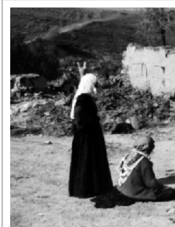
ژناني کورده واري، هه ميشه قوربانيی کاره ساته کان بوون و مافه کانيان پيشلکراوه کاني!

خانه نشيني پيشمه رگه ی ژن و ژنه پيشمه رگه کان و ژنه هاوکراوه کاني شارو شاخدا بجينه وه و کم و کورپه کان ديار ي بکرين. کومه له ی پيشمه رگه دي رينه کاني کوردستان ، له دريژه ی هه ول و ته قه لاکاني خو يدا، له کم و کورپه کان ده پرسيتته وه به دواي داواکاريه گشتييه کاني ژنه تيکو شه ره کانداه چييت و هه رگيز له و بواره دا که مته رخمی ناکات. بو نه م مه به سه تش هه ول نه دات ليژنه ی تايبه تي پيکبه ني ريت بو تا وتويکردني نه و کيشه يه و پله بند کردني خه باتي ئافره تان و ژناني شاخ و شارو به رگري کردن له پيناو هيئانه دی هه موو مافه کاني ژناني شو ر شگير هه رکه سه يان به پي خه بات و تيکو شاني خو ي.