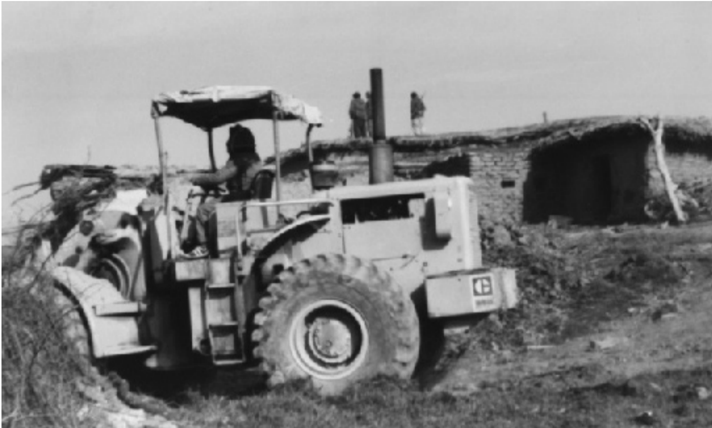
لهنرشيفى نالاي نازاديهوه وهگيراهو

لهگال دهستپيكردى دانگايكردنى سههدام و عهلى هسههن مهجيد(كيميايى) و تومهتبارهكانى هاوپرى لهسر دوسيهي بهدناوى نهفان و ماويههك پيشترپش دهنگوى نهوه ههيوو، كه گوايه نهو فهوجهخهفيفه(جاش)انهى پيش راپهريين، بهر ليبوردى بهرهى كوردستانى كهوتيوون و نهوانهى تا رزگارى عيراق له كركوك و موسل و بهغداو شارهكانى تر لهخزمهتى نهو رزيمه بوون و بهر هيج ليبورديك نهكهوتوون، لههولتى نهوهدان خويان دووباره ناوونوس بكنهوه، ههروهه نهنجومهنى وهزيرانى عيراق فؤرميكى بلاوكردوتهوه بهناوى (كپانات منحلـه قهواره ههلوهشاوهكان)، بؤ ههموو نهوانهى لهرابردو پهبههنديان بهرزيمه ههيووه ئيستا دهوتان پهبههنديهكانيان دووباره بكنهوه و يا نهوهتا قهرهيووى نهو ههموو سالانهى دايريان لهخزمهتى نهو رزيمه بگريتهوه، ههرهلوهباريهوه لهروژى 2006/8/24 دا، وته بيژيك بهناوى سهروكى ههريمى كوردستانهوه، رايگه ياند: ماويههكه دهنگوى وا لهئارادايه كهكونه موستهشارهكان(سهروك جاشهكان) ههولى دووباره خوئاوونوسكردن ددهن و فؤرمى (كپانات منحلـه قهواره ههلوهشاوهكان) پردهكهنوه، وتهبيژهكه هوشدارى دهوات و دهلى بههيج شيوهيهك رى بهنوئيكردنهوى جاشايهتپى لهكوردستان نادهين. ههروهك وته بيژهكه بهردهوام دهين، نهوانهى نهو ههوله ددهن بابزائن كهبهم كار هارهوايهيان.... تاوانه پيشوهكانيشيان زيندو دهكرينهوه بهتومهتى ويرانكردنى گوندو كوشتن و برين و نهفان و كيمياباران، دهنرينه دانگا.